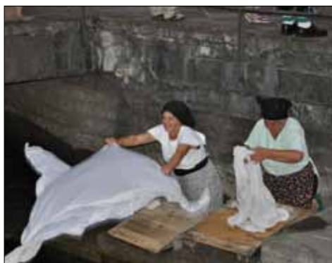
Alcune immagini della serata e del corteo storico.